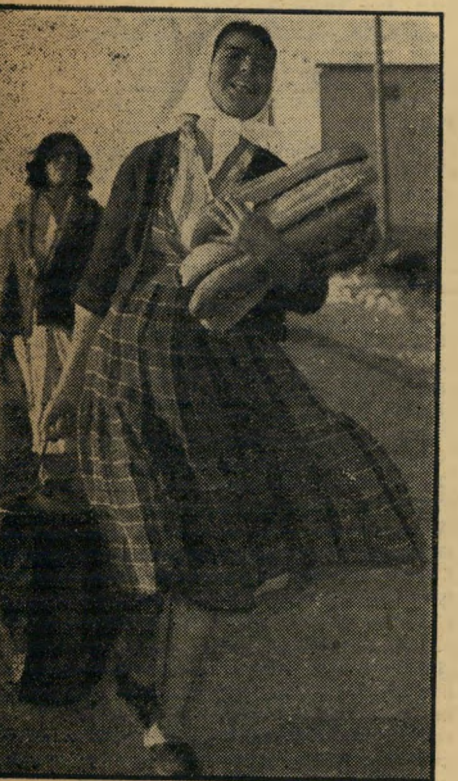
אם השבעה זוהרה בן-ברוך, אם לשבעה יל' דיס. אם ייהרס הלול, לא יהיה לחם לילדיה.