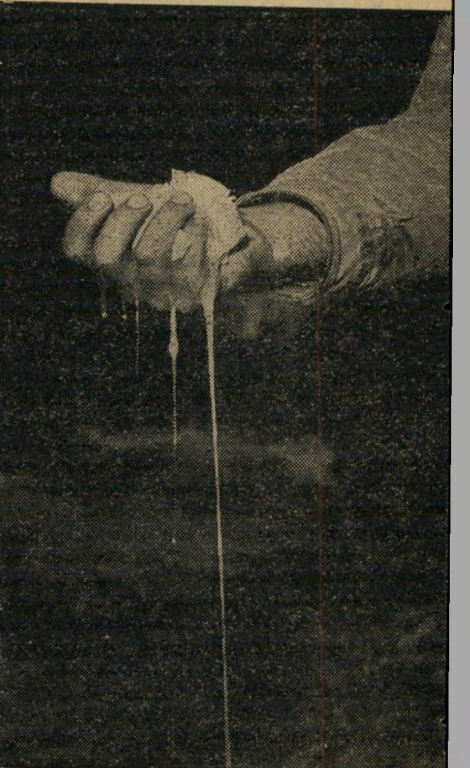
הסמל אחד מתושבי כסלון מדגים את מצב התושבים: כמו ביצה שנמנעה ביד אכזרית ותיזרק לאשפה.