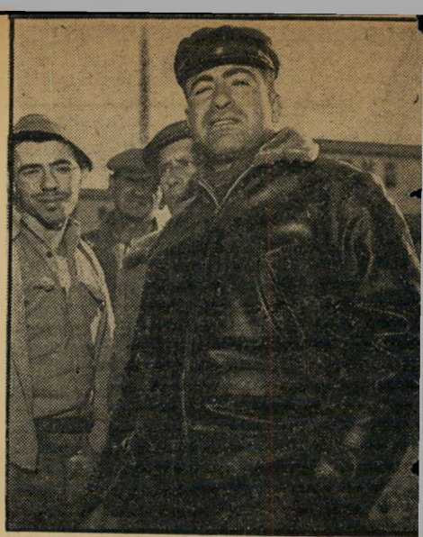
ראש הועד מכלוף בושכילה, 30 מחזיר: "ה' לול הציל אותנו. חיטולו יביא לנו חיים"