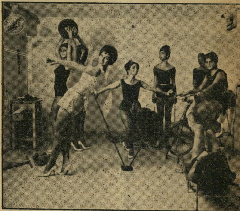
שעור בהתעמלות מלווה בשימוש במכשירים חדישים, שכל אחד מסתמטאם לאפשר הפגלתו של חלק שונה בגוף. נותן לו את הטיפול המתאים: אופניים, קפיצים, כדור-כוח ומסות להפעלת שרירי החזה.

יש גם בעיות אחרות. אשה אחת למשל, ביקשה מהאולפן אישור שיעיד כי הכתמים הכתולים שעל גופה נגרמו על-ידי מכונות ההרזיה ושמקורן אינו בטיפול מסוג אחר.