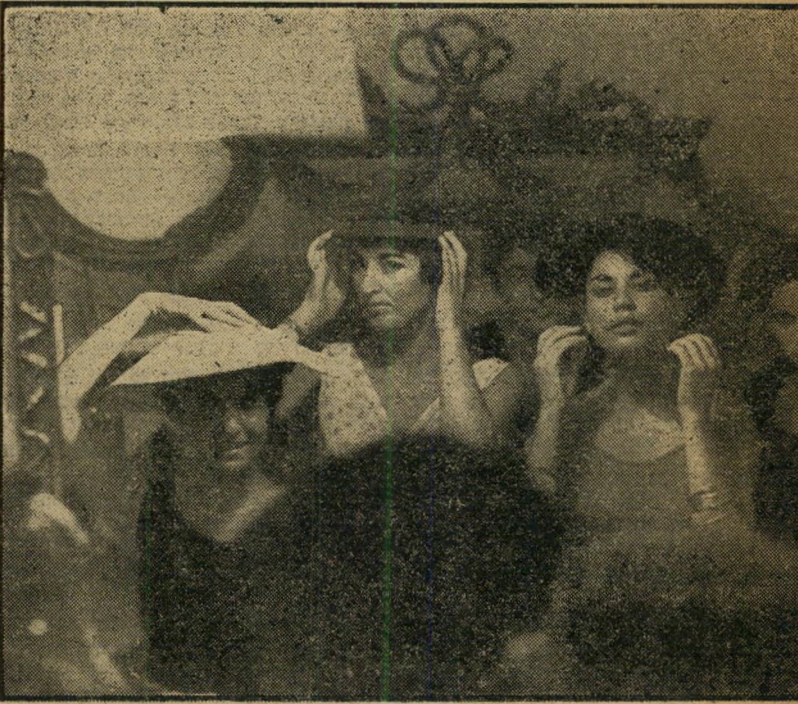
שעור ב"שיק" הוא אחד השיעורים הקשים ביותר. זהו דבר שנוגדים עמו — או בעדיו. לשכתן של הצבריות, שרובן חסרות שיק, יאמר שהן עושות מאמץ לרכוש תכונה נדירה זו. בצילום: כיצד מופיעים בכובע.