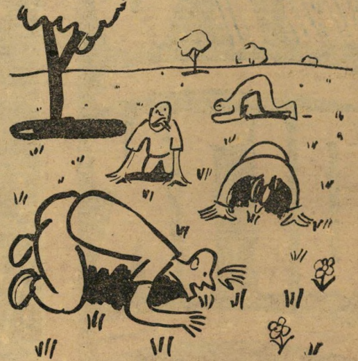
מרעה דשן לצימחונים

בנובמבר 1958 הגיעו הנהשונים: 20 רוקים ו-3 משפחות. הם מצאו כפר עזוב ונטוש, שהרצפה שלו מכוסה קוצים, חוהים, דרדרים, סרפדים ויבלית. לא ראו מלמעלה אפילו בלטה אחת. על הקירות מבחוץ, טיפסו חדרונים ושמומיות ובפנים טוו להם העכבישים וילגונות של משכית הכל היה צימחוני וטבעוני מאוד באחריות על הסכין. התיישבו להם הרוקיים והמשפחות בבתי-הנטושים ויצאו מיד לעבודת-חוץ, ממנה הם מתפרנסים עד היום הזה. אל תטיקו מכה, שהמושב לא משתלם מבחינה חקלאית. להיפך, יש כל הסיכויים שמושב עמירם יהיה המושב הכי רוטאבילי בהתיישבות העובדת, מפני שלא מגדלים כאן פרות (רחח נקי של 500,000 ל"י לשנה!) ולא תרנגולות (רחח נקי של