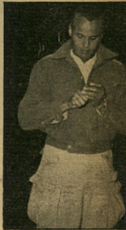
איש מילואים כך נראה הארי בלאפונטה, רי בלאפונטה, בלבשו באסטרדס. הוא חשש להצטנן ברוח.

שאלו מהם נראה מצד ימין, דולקים על שולחן האוכל בבית הילדים. האוירה המלבבת שבתה את לבו של הארי בלאפונטה, הנראה כשהוא קורן מרוב אושר בשבתו על כיסא קטן של ילדים.