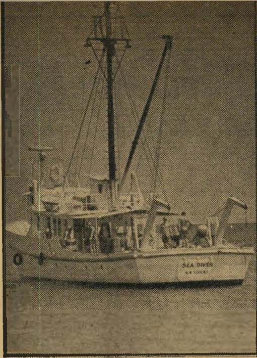
הבטיח אז לינק, "ונחפש את עקבות נמל קיסריה העתיק". השבוע חזרו בני-הווג לא כתיירים, כי אם בראש משלחת של ארכיאולוגים ואמוראים, על סיפון ספינה יחידה במינה בעולם, שנבנתה על-פי הנחיותיו ותוכניותיו של לינק

את התגליות הנרחבות ביותר גילו אנשי סי דייבר ליד