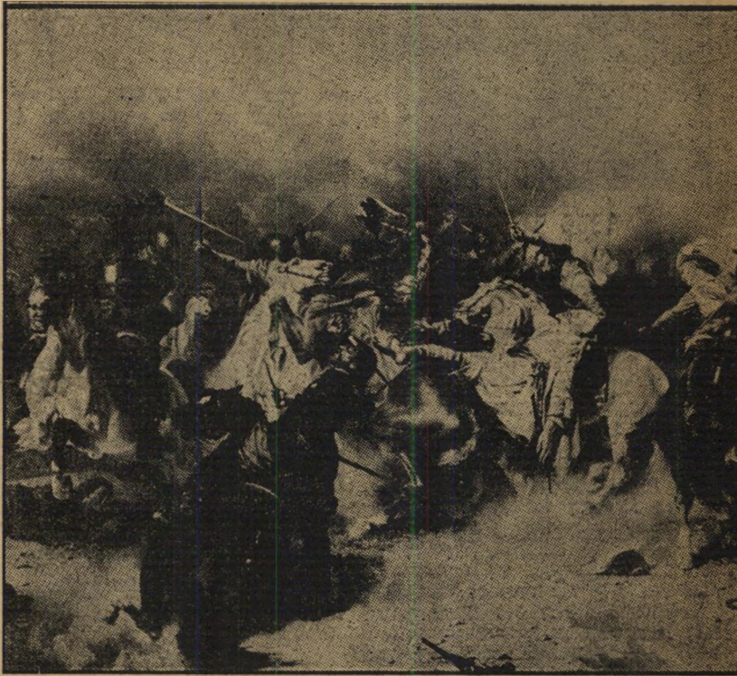
1632 שיאה של מלחמת-שלושים-השנה: מותו של מלך שבדיה, גוסטאב אדולף, בקרב ליד העיר הגרמנית ליצן. בתמונה: המלך קארל-רוואי, שרכב בטעות לתוך שורות-האוייב, ניפצע מכדור, נהרג בחרבות. המלחמה הסתיימה למעשה בתיקו.

מדוע עדה בידי הלאיוצלים לכבוש בקלות כזאת את אחת מאומות-התרבות המפותחות ביותר בעולם? כיצד יכול היה איש כמו אדולף היסלר ליהפך למנהיגם הנערץ של שמונים מיליון גרמנים? כיצד יכול היה עםם של קאנט וגיתה, לוטר ובאך להיכנע ללא קרב לטיפוסים מסוגו של אדולף אייכמן? בין כל הסיבות הרבות מזוקרת תשובה אחת, המתבקשת כמעט מאליה: הלאיוצלים השתלטו על גרמניה מפני שגרמניה עצמה הייתה לאיוצלח קולקטיבי. כאשר אדולף היסלר, הלאיוצלח המונומנטאלי, פתח את פיו — הוא עורר הד אוטומאטי בלבה של אומה שיכלה כולה להזדהות, בתה-הכרתה, עם דמותו של איש זה. הנאציזם, כמחלת-רוח קולקטיבית, יכול להשתלט על כל אומה, כאשר מזדמנות יחד הנסיבות הפוליטיות, הכלכליות והחברתיות המתאימות. אולם בצורתו המיוחדת, ההיסלרית, התאים הנאציזם במיוחד לנשמה הגרמנית. יתכן כי גרמניה לא תהיה המדינה הנאצית האחר