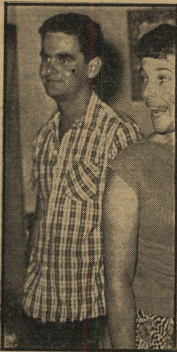
שחקן ברקאי אסון על אסיהדרן

גם בלהקת הנחל וגם בבצל ירוק המשיך להרגים את חיקויי המופלאים. אט אט