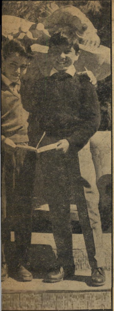
הכפיל חזוליסו (משמאל) בחברתו של יאר מלמד הירושלמי, שהתגלה כבעל דמיון רב לחזוליסו המקורי.

לכתוב! את שהייתו הקצרה ב"חברת בני-גילו, ניצל חזוליסו לשיבה קצרה על ספסל הלימודים, שהזכירה לו את ימי המסעים בבית-הספר.