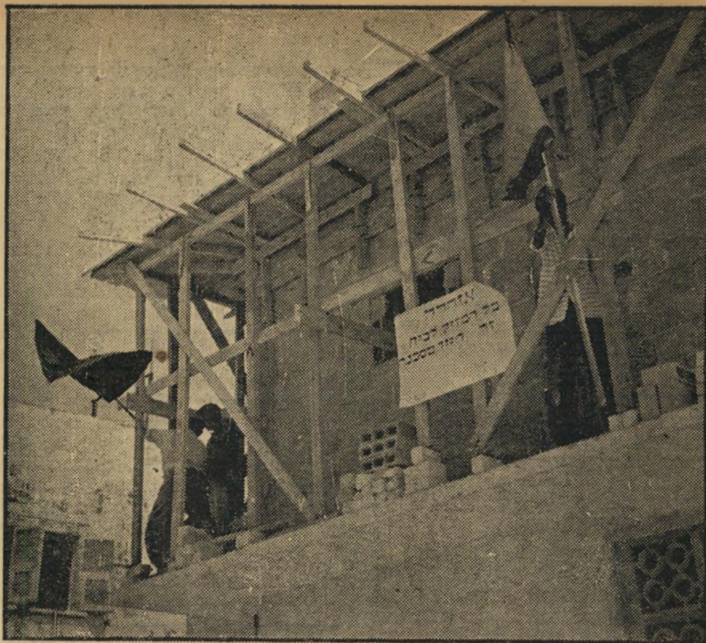
הקומה הכלת-רחוקית בכרם התימנים: דגלים אדום ושחור, ושלט* הוראות מיבציות למאות הנאספים

אחרת לא נותנים. אני הולך ללונדון, שם ישלי חברים, שם בטח נותנים לחיות. המערכה על הבית נדחתה לעת אחרת. היא עלולה גם לא להתקיים אם יגשים מז' רחי את אימו, יהגר ללונדון. אולם מאות בתים שנבנו בכרם ללא רשיון, ועשרות צווי-הריסה שהוצאו נגד בתים אלה, עלולים לפוצץ את השקט שנית. לא בידי העירייה ולא בידי גורמים שהיו אחראים במישורן ובעקיפין למצב זה, לא היתה התשובה כיצד למנוע את הדבר.