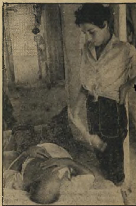
מתמרד מורחי ובתי שלוליות דם על חסף

חרר. בשקמה המדינה הציעה לי העיריה לקבל שיכון בנבעת רמב"ם אבל ביכרתי להשאר כאן, אני דייג איני יכול לנטוש את החוף.“