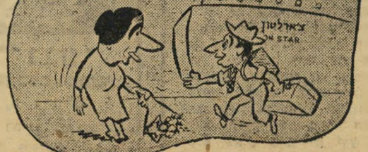
גולדה מאיר מקבלת את פני בנמל

"אינך יודע שהצבא הישראלי עבר את הגבול ונמצא עכשיו 15 קילומטרים מאיסמעיליה?"