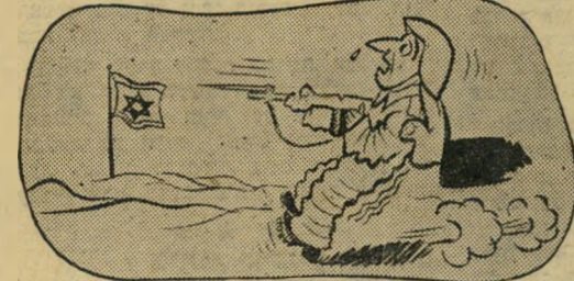
"לך להיחם בישראל, יא זק"י!"