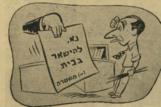
"הם לא רצו לפגוע ברגשותיך..."

בציור. אם כי קרו מקרים שאיחסאן פסל כמה מהקריקטורות שלי, היו אלה תמיד ציורים שנגעו לגמאל עבד אל-נאצר, כסמל המשטר. "זה עלול להתפרש כפגיעה בכבוד הנשיא", היה איחסאן מסביר, או: "צריכים לדעת היכן הגבול, גם כשמותחים ביקורת".