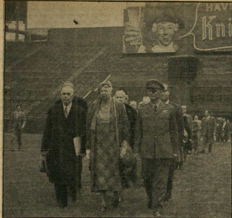
מיצער העשור בניו יורק . באיצטדיון הפולו בניו יורק, התכנסו 40 אלף איש — ברובם המכריע יהודים — לחוג את יום העצמאות העשירי של ישראל. את המיצעד פתחו תזמורת של ארגוני משוחררי המלחמות, ארגונים ציוניים ומקהלת אוניברסיטת ברנדייס. אחריהם צעדו אורחי הכבוד. בתמונה בראש רב'אלוף משה דיין, אלמנתו הנשיא לשעבר אליאנור רוזבלט והסנאטור היהודי הרבנים ליהמן. מאחורי דיין צועד שגריר ישראל אבא אבן.