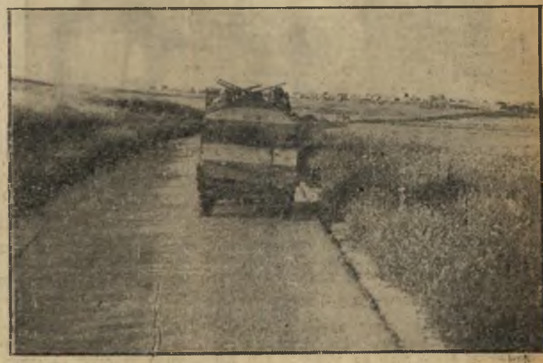
5. לקראת לטרון הטור עובר בכביש ליד דיר-מוחזין. התמונה צולמה תוך נסיעה, ליד המחנה הצבאי בלטרון.