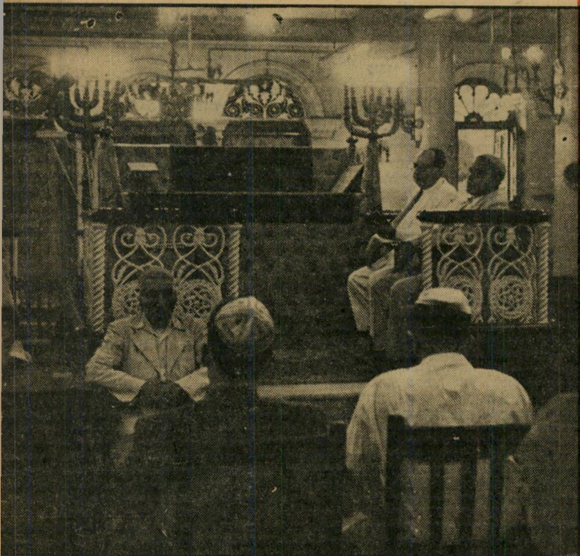
הקהילה היהודית בראנגון מנהלת את חייה הדתיים בבית-הכנסת תכלית שינוי בצורתו ובקישוטי מהמקדשים הבורמיים, רבי ה